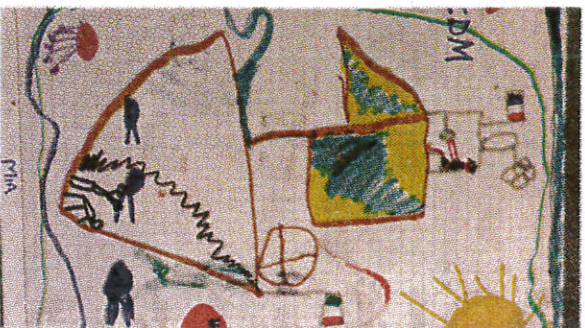
Il disegno di Giovanni Trivisano