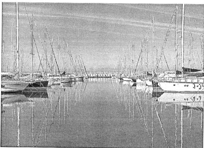
Nella foto: un'immagine di Cala de' Medici.

Oltre 200 chilometri della Canottieri di Firenze