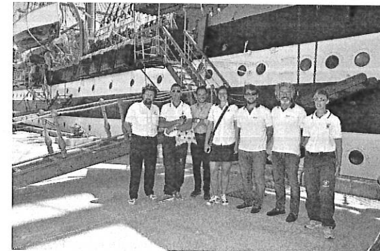
Nella foto: la visita a bordo di Nave Vespucci.